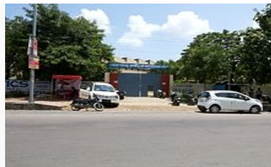
Dhyan Chand Sports Stadium at Jhansi

Even today, Dhyan Chand remains a legendary figure in Indian and world hockey. His astounding skills have been glorified in various apocryphal stories and anecdotes. A number of such these revolve around the fact that Singh had a magical control over dribbling the ball. “29 August, Chand’s birthday, is celebrated as National Sports Day in India.”