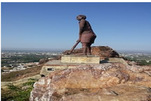
Dhyan Chand statue at Sipri hill, Jhansi

Dhyan Chand died on 3 December 1979 at the All India Institute of Medical Sciences, Delhi. He was cremated at the Jhansi Heroes ground in his hometown, after some initial problems in getting clearance. His regiment, the Punjab Regiment, accorded him full military honours.