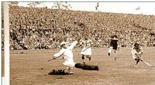
Dhyan Chand scoring a goal against Germany in the 1936 Olympics hockey final

4). On 10 August, Ali Dara arrived. Their fourth match was the semi-final against France, whom they defeated 10-0, with Chand scoring 4 goals. Meanwhile, Germany had beaten Denmark 6-0, beaten Afghanistan 4-1 and in the play-offs, had defeated the Netherlands 3-0. Thus, India and Germany were to clash in the 1936 Berlin Olympics field hockey final on 15 August.